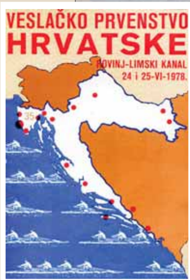
Plakat Veslačkog prvenstva Hrvatske održanog u Limskom kanalu 24. i 25. lipnja 1978.